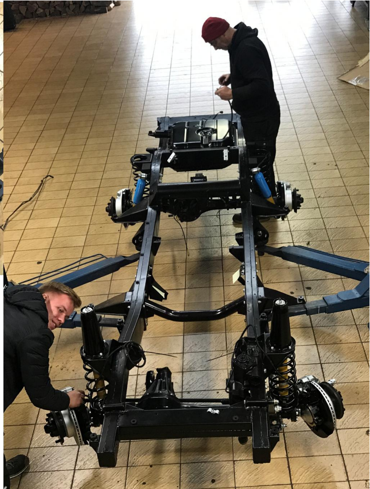
Otte baut zusammen mit Elias ein frisch restauriertes Range Fahrgestell zusammen, unbedingt soll das "Rolling Chassis" noch 2019 auf eigenen Rädern stehen.