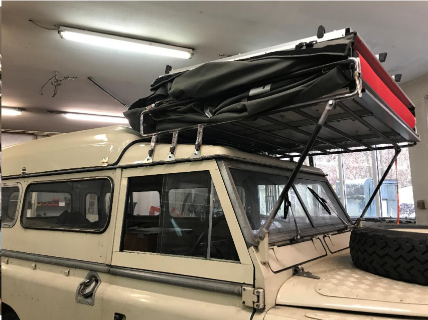
Janos arbeitet noch an einem individuell angefertigten Dachträger für ein Dormobile, damit dieser noch zum Verzinker kann.