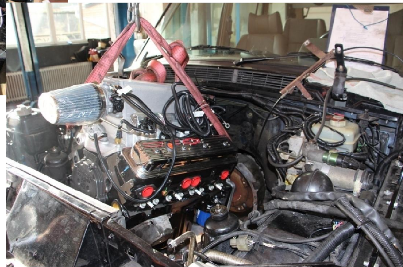
Und drin iss er...., aber jetzt geht die eigentliche Fummel Arbeit los...in Ruhe