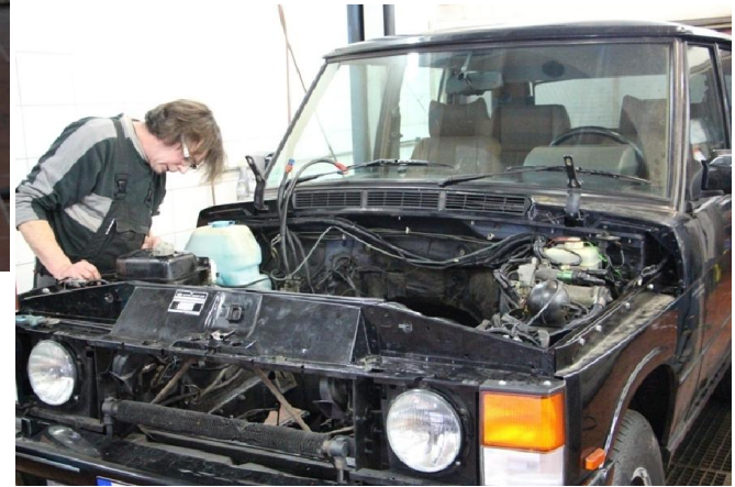
Ole bei der Vorbereitung eines Motorraums zur Aufnahme eines 350 PS Boliden,