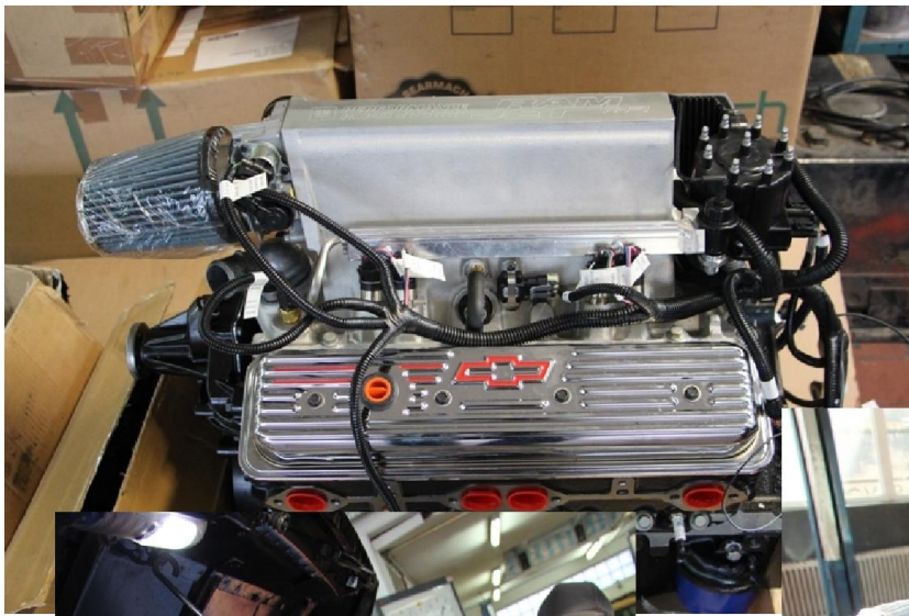
Kai und Tiger diese Tage noch sorgsam in den Range Rover einbauen